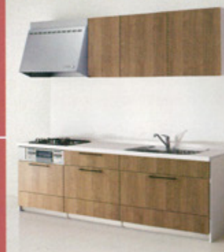
写真セットは class5 クラシカルバーチ