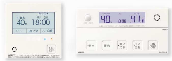
「RC-G001EW」左：台所リモコン、右：浴室リモコン

2018年9月発売のリモコン「RC-G001EW」は、入浴時の安心をサポートする「見まもり」機能を業界で初めて搭載した高効率ガスふろ給湯器「GT-C62 シリーズ」、および同機能を搭載した高効率ガス温水暖房付ふろ給湯器「GTH-C シリーズ」向けで、スマートフォンを使ってリビングなど宅内からの入浴者の「見まもり」が可能のほか、外出先からの「お湯はり」、「温水暖房」などの操作ができます。今回の新システムにより、スマートスピーカーを介して音声での操作も可能となりました。