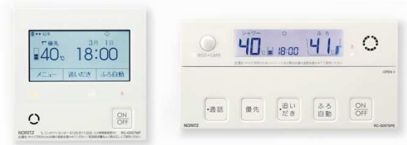
「RC-G057PEW」左：台所リモコン、右：浴室リモコン

対応リモコンの追加発売に関しては、環境・省エネルギーと快適性を両立したハイブリッド給湯・暖房システム「ユコア HYBRID」用の無線 LAN 対応新リモコン「RC-G057PEW」を3月1日に発売します。こちらにも、リビングなど宅内からの入浴者の「見まもり」がスマートフォンで可能なほか、外出先からの「お湯はり」、「温水暖房」などの操作がスマートフォンでできます。今回の新システムにより、スマートスピーカーを介して音声での操作も可能となりました。